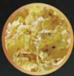
Copos de maíz termoaplastados y molidos