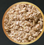
Salvado de trigo