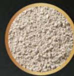
Vitaminas y minerales