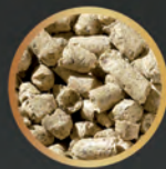
Cascarilla de soja