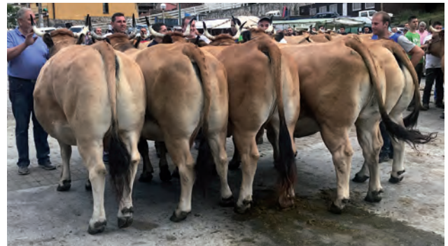
LOTE DE VACA CULÓN NACIONAL LOTE - Ganadería Casa Manolo S.C. de Salas