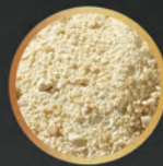
Grasa vegetal By-Pass